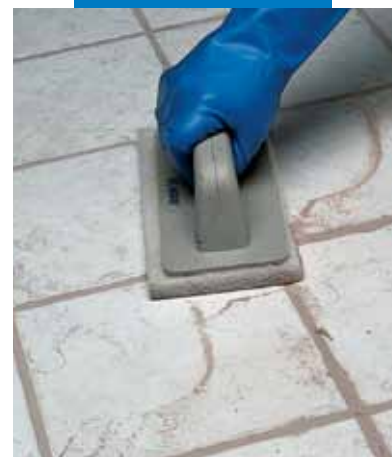
Tisztítás Scotch-Brite® súrolószivaccsal