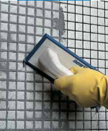
Üvegmozaik (fürdőszoba) fugázása simítóval