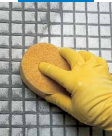
Üvegmozaik tisztítása szivaccsal