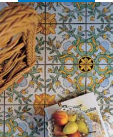
Példa fugázott kétszer- égetett padlóburkolatra

Normál, száraz körülmények között, eredeti, bontatlan papírsák-csomagolásban 12 hónapig, alumínium / műanyag csomagolásban 24 hónapig. Magas hőmérsékleten és/vagy magas páratartalom mellett tárolva a polcidó meg rövidülhet.