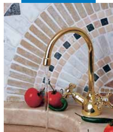
Példa fugázott mozaik burkolatú konyhára