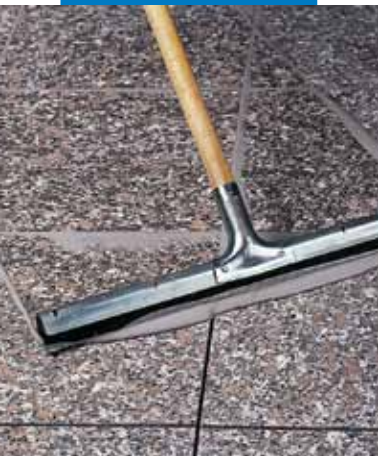
Előcsiszolt és fényezett gránitpadló fugázása gumilehúzóval