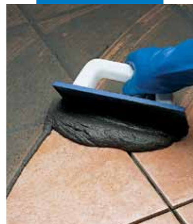
Egyszer-égetett burkolólap fugázása simítóval